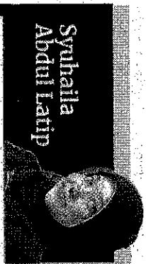
Pegawai Syarie (Perunding Keluarga dan Pewarisan)

Pengurusan dan pembahagian harta pusaka termasuk perkara yang perlu disegerakan, tetapi ia perlu dilakukan adil serta mengikut hukum syarak. Paling penting, waris atau orang lain tidak terpalit dengan risiko menggunakan harta si mati ke arah tidak telus dan batil.